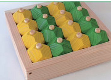
那賀町の誕生祝い品「ゆずつみき」

那賀町では町民の方々に木の魅力を知っていただくべく、「木育」を推進する活動を続けています。2017年度には、全国で32番目、徳島県内としては初のウッドスタートを宣言を行い、誕生祝い品として「ゆずつみき」を配布しています。この度の那賀町山のおもちゃ美術館の設立も、新たな「木育推進施設」として、様々な情報発信、そして体験を提供できるよう、整備を進めています。